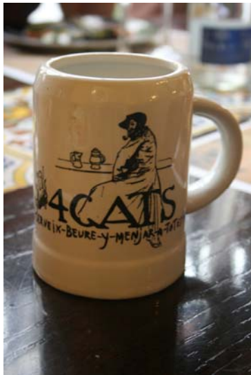
Chope de bière (4 Gats)