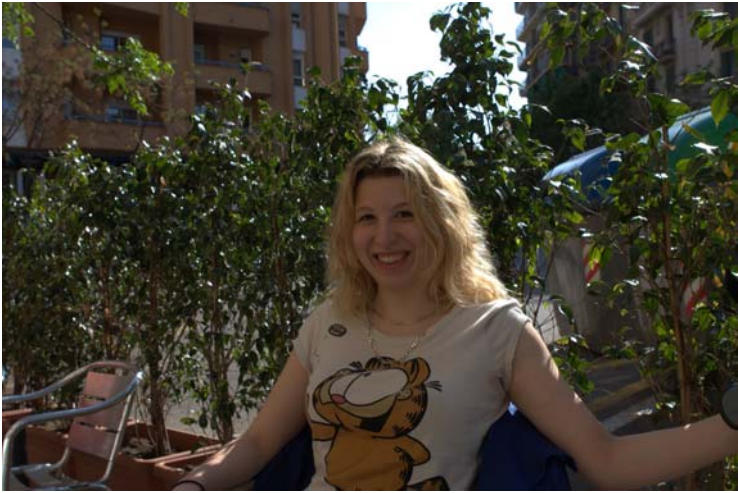
A la sortie du Palau de la Musica, au soleil