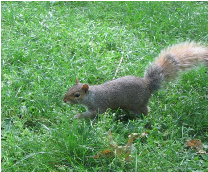
Ecureuil au Parc La Fontaine (Montréal)