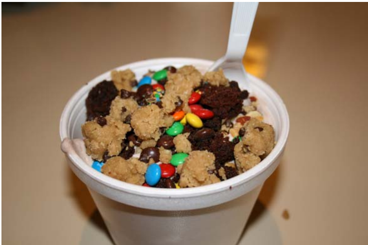
Mon pot de glace