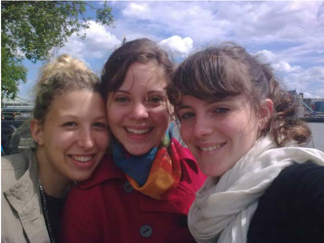
Première visite londonienne de mes cousines