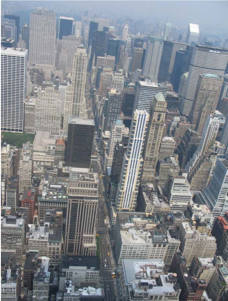
Vue de l'Empire State Building