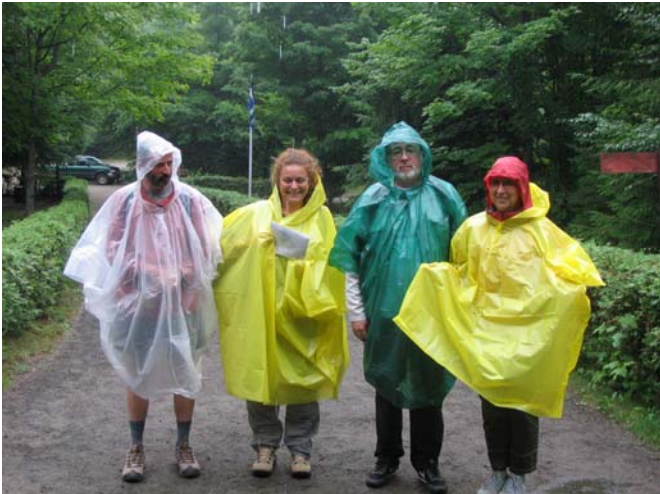
Petite promenade sous la pluie (Mont Tremblant)