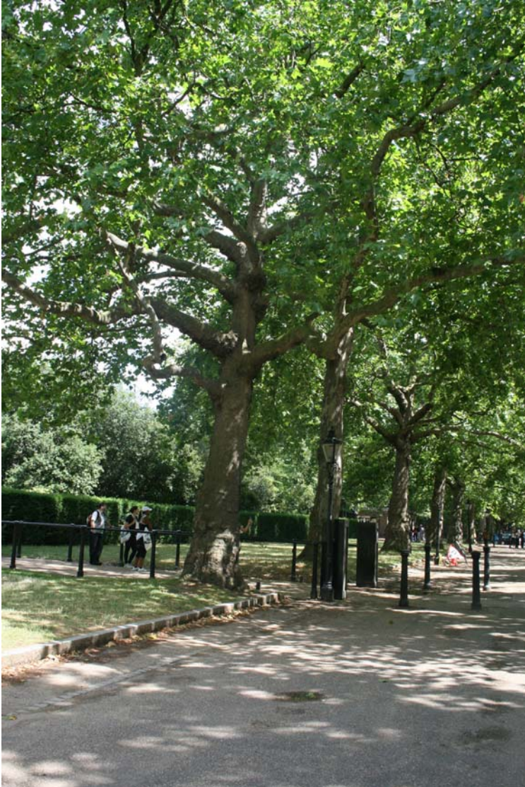
L'arbre qui nous a abrités