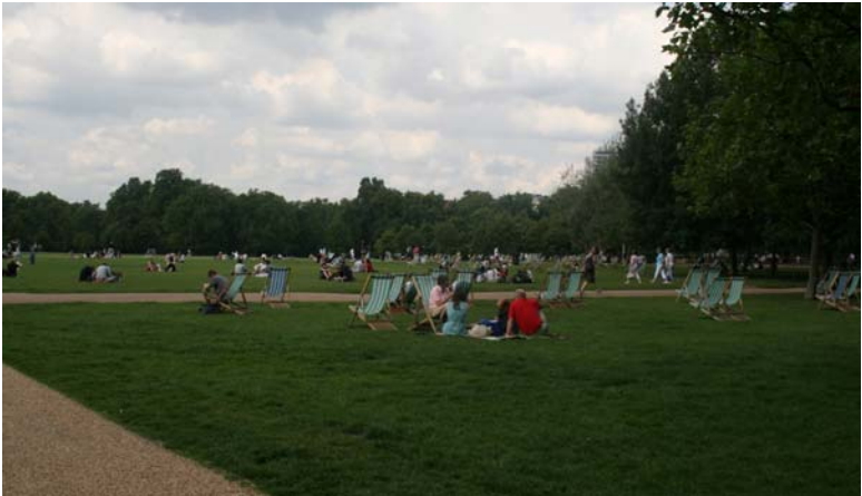
Break avant de mettre le cap vers le sud