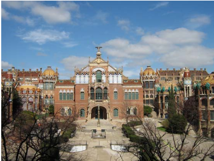
Hopital San Pau