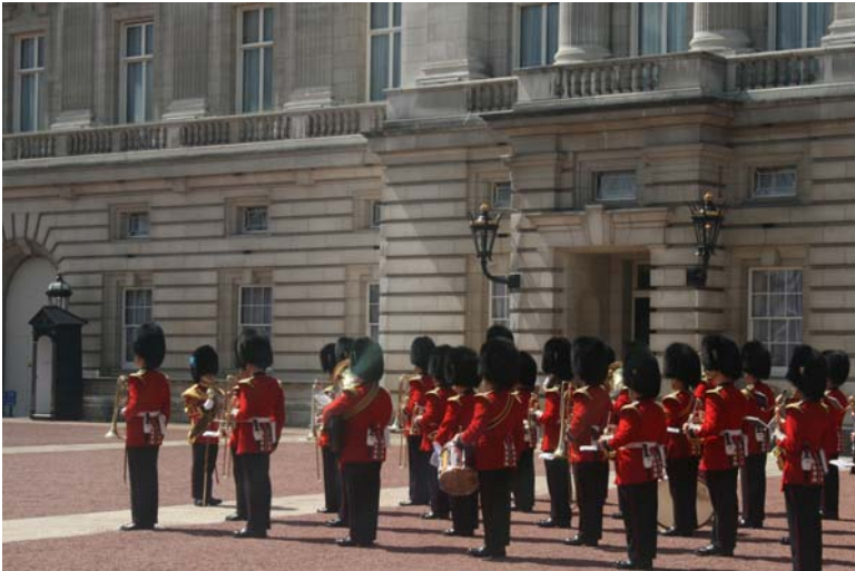
« Changing the guard »