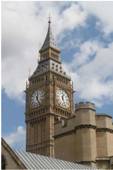
Longues heures londoniennes (Big Ben)