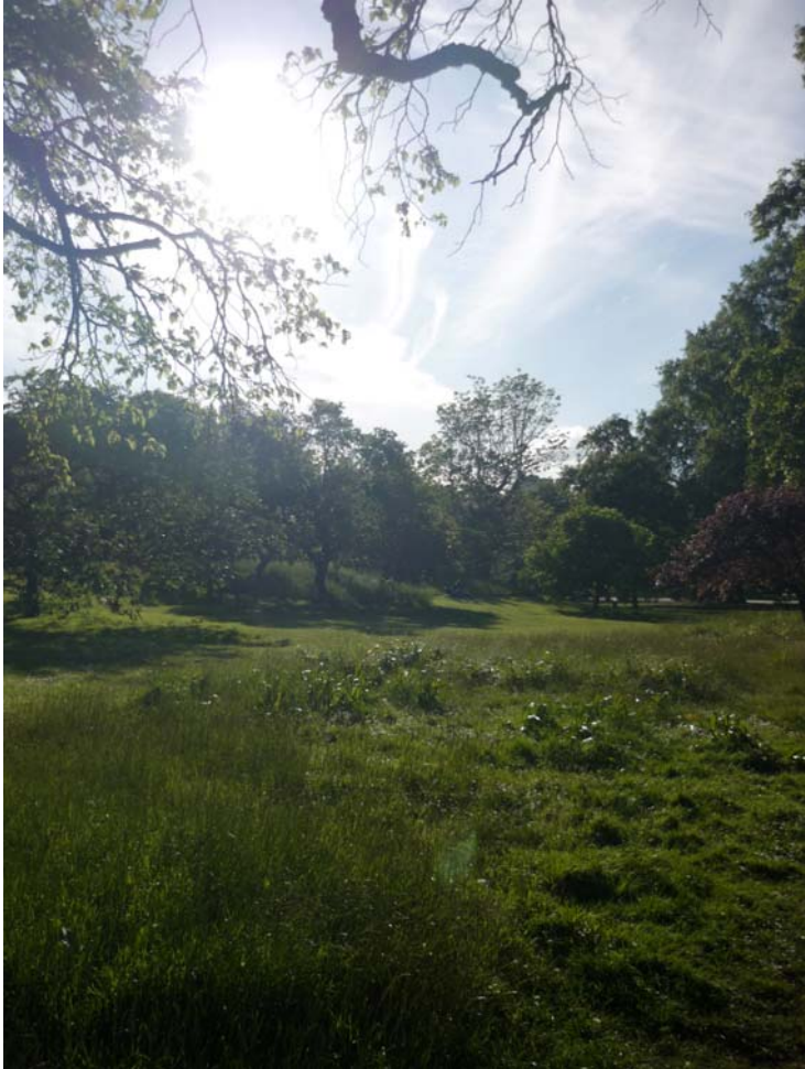
St James Park