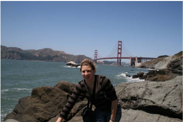
Petite balade sur les rochers