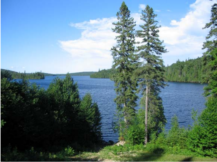
Le lac Beauregard (Mont-Laurier)