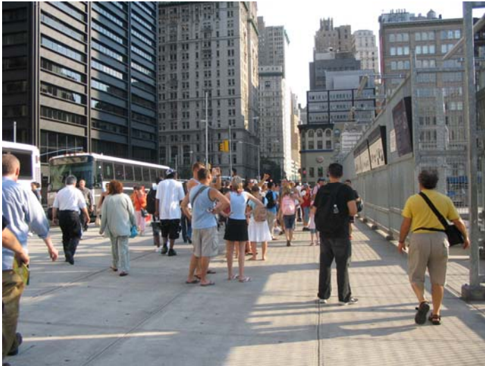
Foule devant Ground Zero