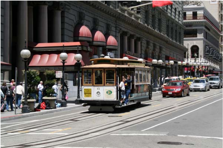
Le célèbre cable car