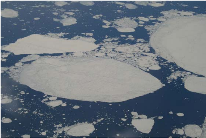
Banquise vue d'avion