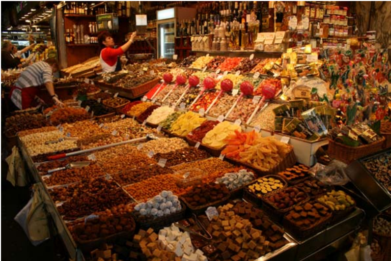
Mercado de la Boqueria