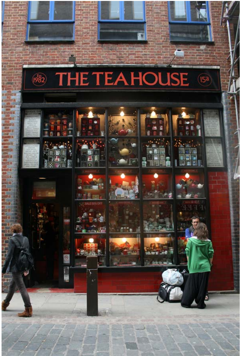
Boutique de thé